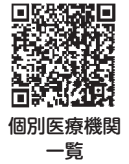
個別医療機関 一覧