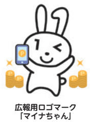
広報用ロゴマーク「マイナちゃん」

A 予約・申し込みサイト上で決済サービスを1つ選択してマイナポイントを申し込み後、9月末までにチャージまたはお買い物をする