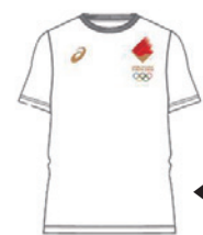
←オリンピックTシャツ

パラリンピック担当 ☎481-7447・E chofu_vol@w2.city.chofu.tokyo.jpへ