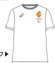
パラリンピックTシャツ