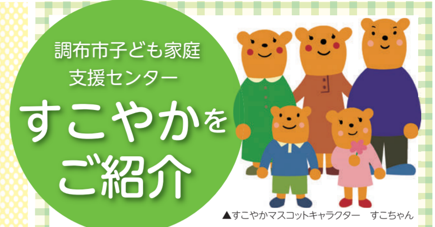
▲すこやかマスコットキャラクター すこちゃん