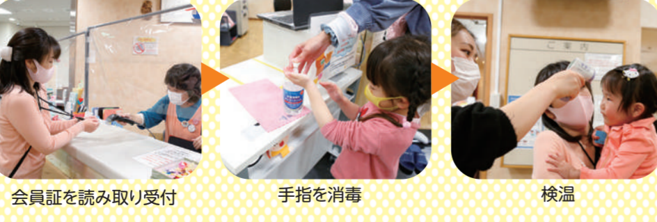
会員証を読み取り受付