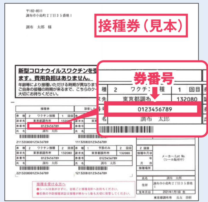
電話予約・インターネット予約ともに、券番号が必要です