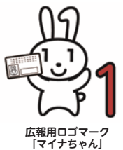
広報用ロゴマーク「マイナちゃん」