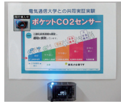
③ 管財課 ☎481-7174