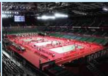
バドミントン(7月24日~8月2日:武蔵野の森総合スポーツプラザ)