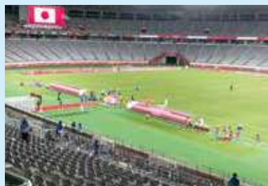
サッカー (7月21日・22日:東京スタジアム)