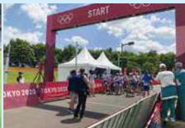
自転車ロードレース (7月24日・25日:武蔵野の森公園)