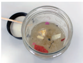
海洋プラスチックごみ

日9月18日(出)午前10時～正午※小雨決行 時9時50分・1階大集会室 定申し込み順10人 費100円(保険料) 備歩きやすい服装、軍手またはゴム手袋、ごみ拾い用