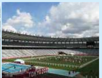
近代五種 (8月6日・7日:東京スタジアム)