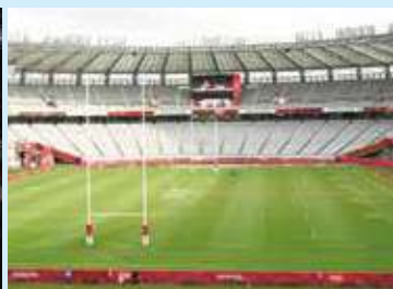
7人制ラグビー (7月26日~31日:東京スタジアム)