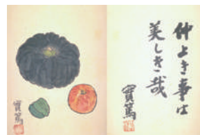
武者小路実篤「古稀帖」1954年