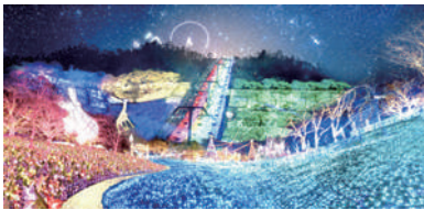
相模湖プレジャーフォレスト

時 午前7時20分頃・仙川駅、7時30分頃・国領駅、7時40分頃・文化会館たづくり前