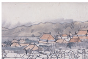
武者小路実篤「北京風景」 昭和18(1943)年4月