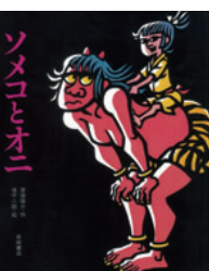
「ソメコとオニ」 斎藤隆介・作 滝平次郎・絵 岩崎書店