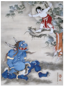
曾我蕭白 雪山童子図 紙本着色 169.8×124.8 明和元(1764)年頃 三重・継松寺

程・日①2月19日(休)・「知る」～鑑賞する前に②26日(休)・「見る」～東京都美術館「奇想の系譜展～江戸絵画ミラクルワールド」鑑賞③3月5日(休)・「語る」～印象に残った作品をそれぞれの言葉で語る 申午後2時～4時