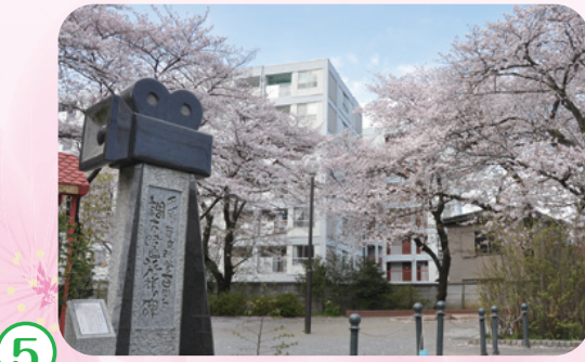
5 多摩川五丁目児童遊園 角川大映スタジオの近くにあり、「映画俳優の碑」「調布・映画発祥の碑」が有名な公園で桜を楽しめます。