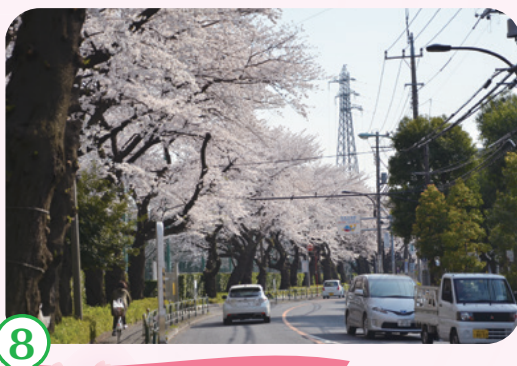
8 三鷹通り JAXA調布航空宇宙センター前の道路沿いに桜並木が続いています。