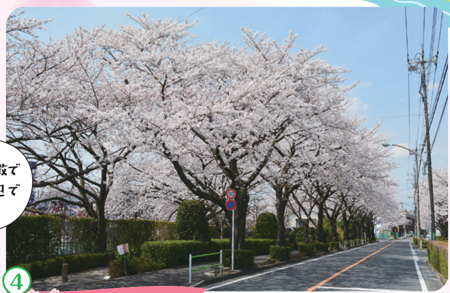
4 桜堤通り 京王多摩川駅から染地まで多摩川に沿うように続きます。彫刻のある散歩路では9点のオブジェと桜のコラボレーションが見られます。