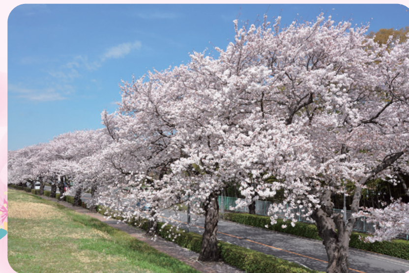
6 染地・多摩川周辺 多摩川住宅の外周や多摩川の土手の桜並木は、散歩やランニングしながら楽しめます。