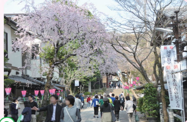
9 深大寺周辺 深大寺通りや境内に多くの桜があります。深大寺を散策しながら、桜を楽しんでみてはいかがでしょうか。