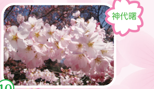
10 都立神代植物公園 平成3年に新しい品種として命名された神代曙の原木のほか、古くからある品種を含め、約60種、750本の桜を見ることができます。

神代植物公園「椿・さくらまつり」 期 3月12日(火)～4月14日(日) ※毎週月曜日は休園日。3月25日(月)、4月1日(月)は臨時開園日 時 午前9時30分～午後5時(最終入園は4時まで) 趣 椿・さくらガイドツアー、つばき・さずんか園見学、つばき展、さくらコンサート、講演会・ガイド「さくらの楽しみ方」 入 園料/一般・大人500円、65歳以上250円、中学生200円、小学生以下と都内在住・在学の中学生は無料 場 都立神代植物公園サービスセンター ☎483-2300 (産業振興課)