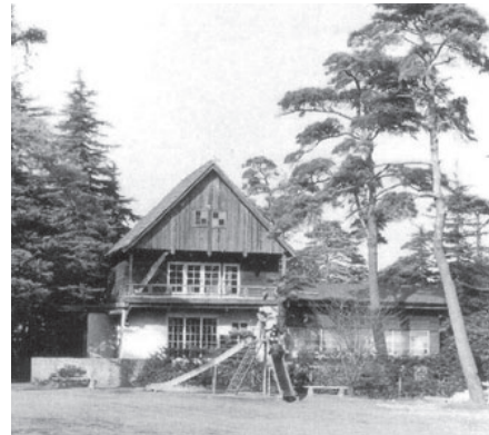
昭和35年撮影 現北部公民館以前の上ノ原分館