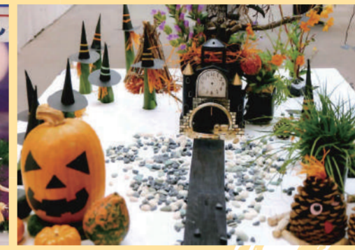
調布市フラワーデザイン協会