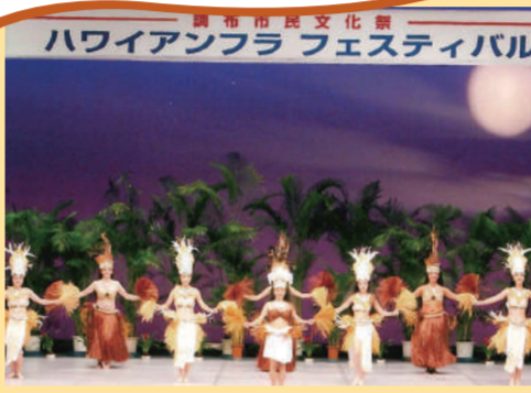
調布市ハワイアンフラ協会