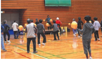
ボルトレーニング