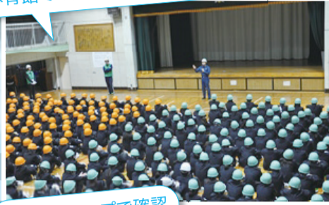
ハザードマップで確認