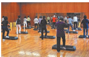
ステップトレーニング