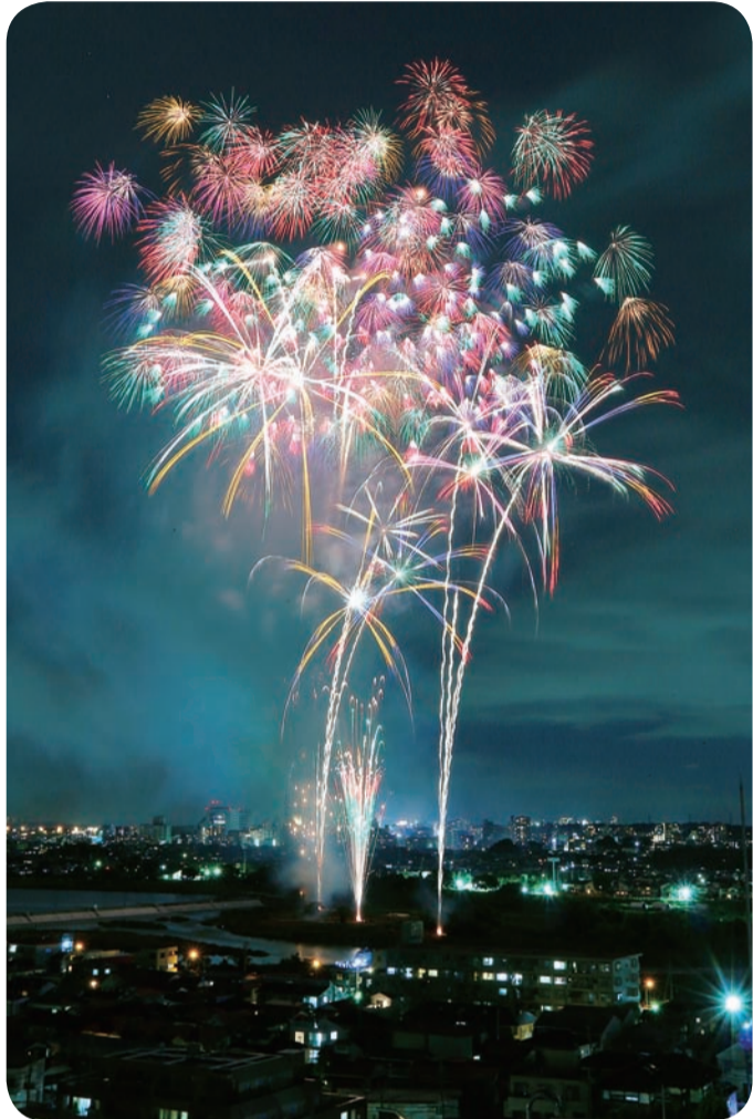
10月27日(土)※荒天中止 調布市花火実行委員会 ☎481-7311・「映画のまち調布“秋”花火2018」 (産業振興課)

調布花火の開催に向けて、調布市花火実行委員会が5月16日に発会しました。音楽と花火がコラボする名物「ハナビリュージョン」、最大8号玉の大玉打ち上げなど、多彩なプログラムでお届けする予定です。実行委員会では、運営費を賄うため協賛(広告宣伝・特典あり)をお願いしています。また、有料席チケットを8月から販売する予定です。