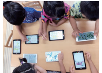
プログラミングであそぼうの様子

期12月3日(月)～平成31年3月15日(金) 調せんがわ劇場 ☎03-3300-0611