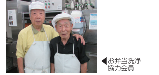
◀お弁当洗浄協力会員