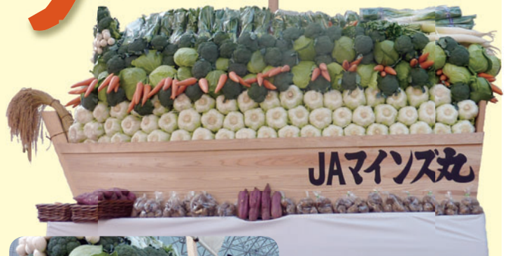
「宝船」の製作に使用した農産物のチャリティー即売を実施