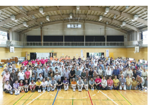
老人クラブの輪投げ大会

公園清掃などの社会奉仕活動や、輪投げ、ペタンク、グラウンドゴルフをはじめとした健康増進活動、カラオケや囲碁などの生きがい高める活動などに取り組んでいます。調布市老人クラブ連合会は今年で創立50周年を迎え、市民公募により、愛称が「さるすべりシニア調布」に決定しました。現在、市内に35のシニアクラブ(老人クラブ)が活動しています。☎社会福祉協議会 ☎481-7693