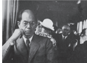
「欧米旅行先にて」昭和11(1936)年7月