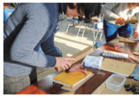
前回の製本講座の様子