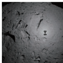
高度70mから撮像したリュウグウと「はやぶさ2」