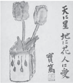
チューリップ 天に星 紙本墨画淡彩

●移動展「調布に暮らした武者小路実篤 展～自然は美しい人生も美しい～」 ㊟2月24日(金)まで ㊟午前10時～午後6時 ㊟文化会館たづくり1階展示室 ㊟来場者は「武者小路実篤名言おみくじ」を引けます