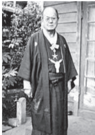
文化勲章受章のとき

●実篤記念館「友の会」 会員特典/「友の会ニュース」(隔月)・ 報報「美愛真」(年2回)の送付、入場料半額、ミュージアムグッズ1割引(実篤カレンダーは2割引。一部グッズを除く)など 年会費/一般会員:1000円、 賛助会員:1口5000円(何口でも可) ㊟電話または直接実篤記念館へ