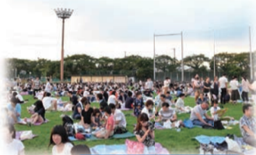
電通大グランド会場の様子

安全確保のため、花火当日は周辺道路で交通規制を行います。詳細は、市報10月20日号でご案内します。