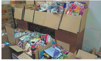
図11月1日(水)午前9時~午後3時 図市役所2階総合案内所前