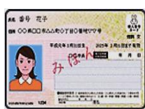
マイナンバーカード (個人番号カード)