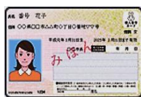
マイナンバーカード (個人番号カード)