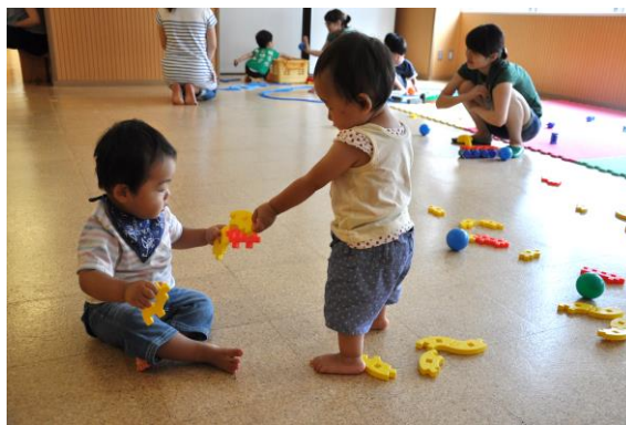
子ども家庭支援センターすこやかの様子

○ 調布市子ども条例の理念を具現化するため、子ども・子育て支援法（平成24（2012年）8月制定）に基づき策定した調布っすこやかプラン（調布市子ども・子育て支援事業計画）（平成27（2015）年度～令和元（2019）年度）について、子育て支援に関するニーズ等を把握しながら、令和2（2020）年度からの次期計画を策定し、引き続き、計画に基づき子どもと子育て家庭を総合的に支援していく必要があります。