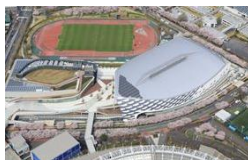
<武蔵野の森総合スポーツプラザ>