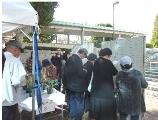
<第42回調布市農業まつりの様子>