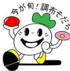
調布産農産物ブランドキャラクター