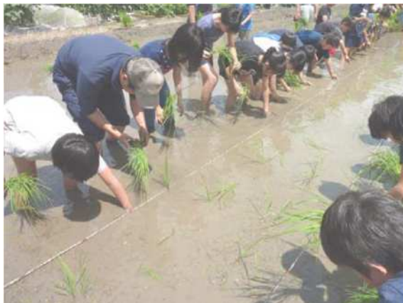
学童農園における田植えの様子

調布市内の農地の8割以上が生産緑地地区に指定されていますが、相続の発生などによりその面積は年々減少し、住宅へと転用されています。都市農地を保全・活用していくため、平成30（2018）年度から生産緑地地区に定めることができる区域の面積要件を500m 2 から300m 2 に緩和する条例を施行し、生産緑地地区の追加指定を行うとともに、特定生産緑地の指定に向けた取組を進め、引き続き都市農地の保全・活用を図る必要があります。