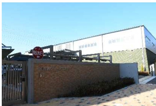
調布市クリーンセンター

老朽化が進むふじみリサイクルセンターの機能再編に向け、三鷹市、ふじみ衛生組合と協議・検討を進めます。