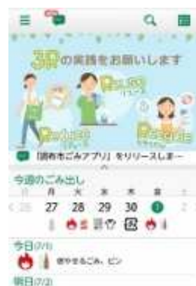
ごみアプリ画面イメージ