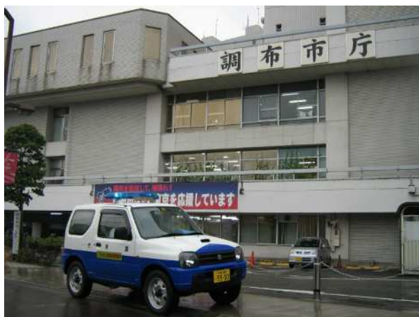
安全・安心パトロール