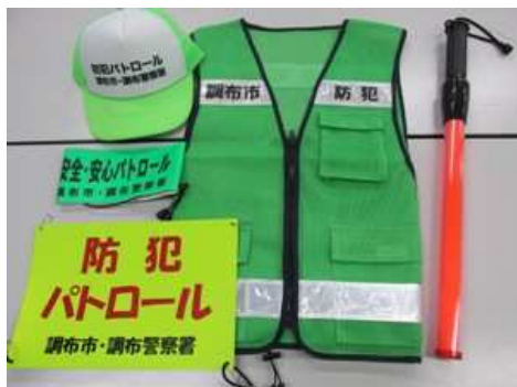
防犯パトロール活動支援用品