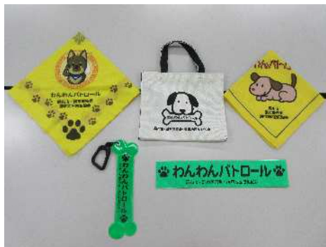
わんわんパトロール支援用品