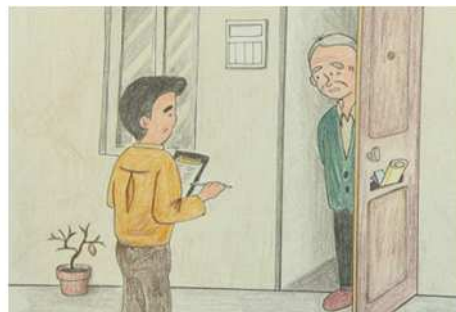
<民生委員・児童委員による地域福祉活動イメージ>