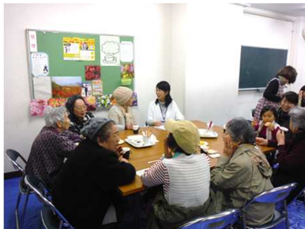
<ひだまりサロンの様子>

地域の中で、一人一人が孤立することなく、お互いに支え合い助け合って、安心した生活ができるよう、ひだまりサロン等の住民同士のつながりの場を充実させていくことが必要です。