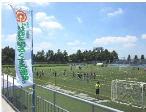
<社会を明るくする運動「中学生サッカー教室」>

（調布保護司会，調布・狛江地区更生保護女性会，調布市民生児童委員協議会，調布市赤十字奉仕団，調布市健全育成推進地区委員会，調布市青少年補導連絡会，市立学校PTA 他）