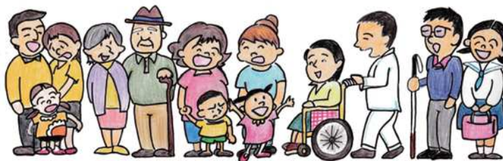
福祉3計画共通の将来像イメージ

平成30(2018)年3月に策定した調布市地域福祉計画，調布市高齢者総合計画及び調布市障害者総合計画の福祉3計画において，福祉の共通事項として将来像，基本理念，福祉圏域を定めました。福祉圏域については，これまで計画ごとに異なっていた圏域を再編・整理し，福祉3計画が連動し，より重層的な支援による解決を図る必要性があることなどを踏まえ，地域コミュニティ等の共通基盤である小学校区を基礎とし，複数の小学校区で構成される新たな8つの圏域としました。