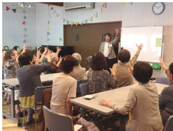
< 高齢者健康づくり事業の様子 >

【協働のパートナー】調布狛江麻雀組合，東京YWC A国領，ソング布田， 東京都柔道接骨師会武蔵野支部調布地区，八雲台小学校地区協議会， 調布市将棋連盟 など