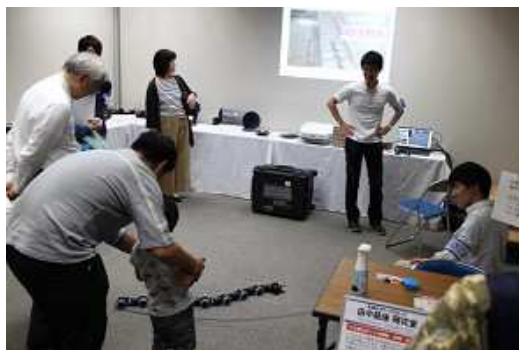
<電通大展 in たづくりの様子>