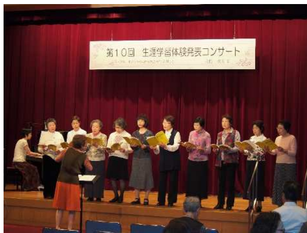
生涯学習体験発表コンサート