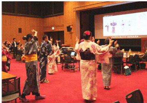
<地域デビュー歓迎会の様子>