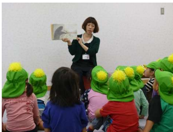
おはなし会の様子