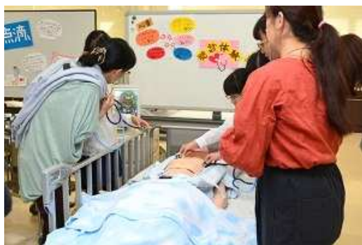
<中学生のための東京慈恵会医科大学 一日体験入学の様子>

【協働のパートナー】相互友好協力協定締結大学（電気通信大学・明治大学・桐朋学園・白百合女子大学・東京外国語大学・慈恵大学・ルーテル学院大学）