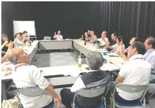
<地域デビュー推進委員会の様子>