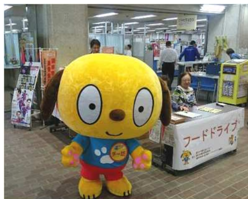
<フードドライブの実施>

【協働のパートナー】調布市社会福祉協議会、 地域包括支援センター、 東京都、調布市消費者団体連合会