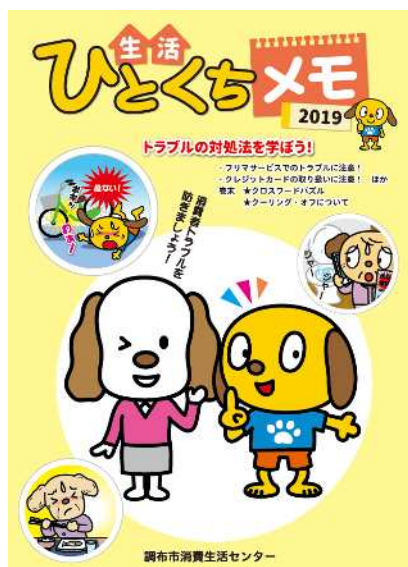
消費トラブルを未然に防ぐための広報「生活ひとくちメモ」