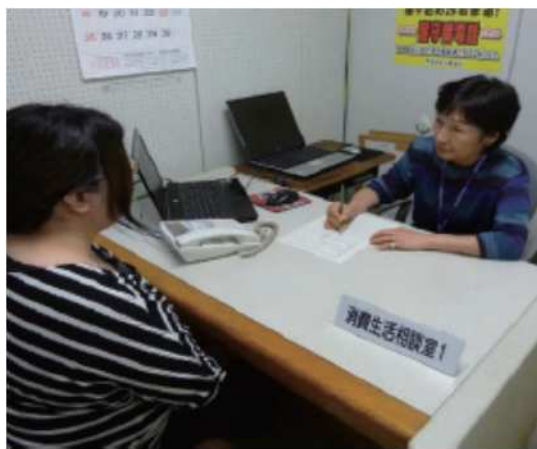
消費生活相談の様子