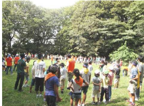
リーダー養成講習会