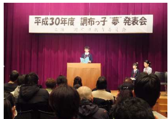
調布っ子“夢”発表会

青少年の健全育成に向けた居場所・活動場所として，多くの青少年が児童館や青少年ステーション，青少年交流館等を利用しており，引き続き，利用者のニーズを踏まえた特色ある事業を実施していく必要があります。