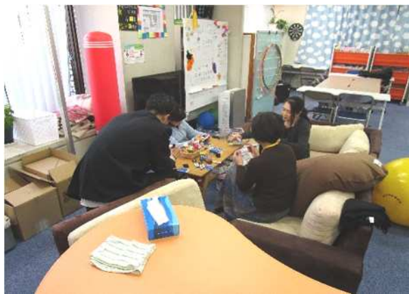
<居場所事業の様子>