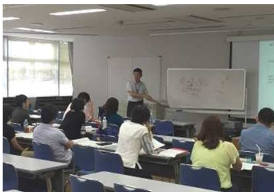
<中小企業支援セミナーの様子>