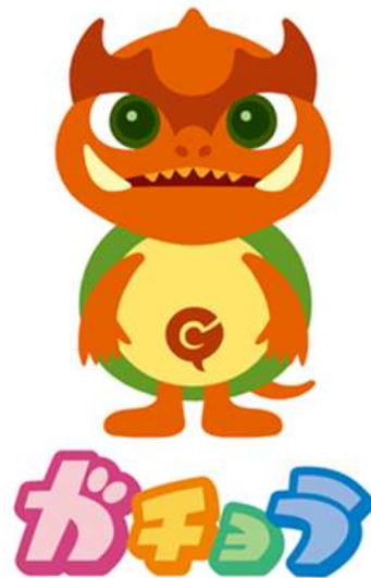
映画のまち調布 応援キャラクター 「ガチャラ」