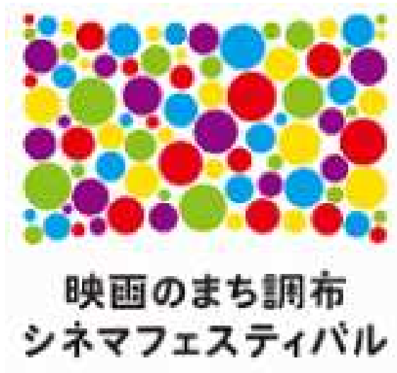
映画のまち調布 シネマフェスティバル