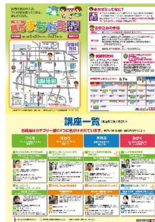
<調布まちゼミのチラシ>