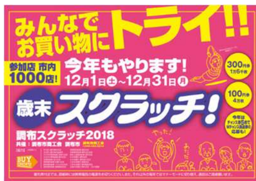
スクラッチカード事業

市内での購入比率の向上に向け、地域情報誌や市ホームページで商店会や特色あるお店を紹介したほか、ウォークラリー等の商店街イベントの支援やスクラッチカード事業の実施など、「バイ調布運動」を促進しています。引き続き、市内の消費喚起や商業の活性化、市民生活支援を図る取組を展開していく必要があります。