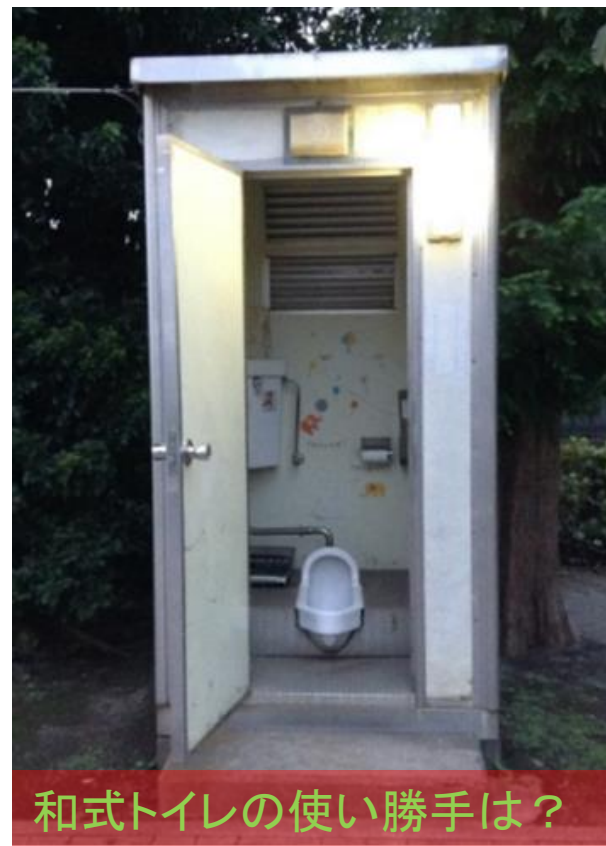
和式トイレの使い勝手は？