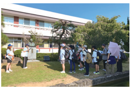
ピースメッセンジャーの長崎でのフィールドワークの様子

教員には、勤務を時間で管理することが必ずしも適切でない勤務形態の特殊性があることから公立の義務教育諸学校等の教育職員の給与等に関する特別措置法に基づき、超過勤務手当及び休日給は支給されず、これに替わる給与として、原則として給料月額額の4%が支給されるもの。