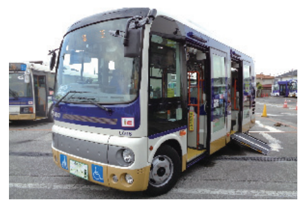
バスの減便やルート廃止が相次ぎ 課題となる公共交通

々な活動における場の確保に取り組む。市民の交流を通じて、豊かな文化芸術・スポーツ活動を育むまちづくりに取り組む。気候変動による夏の暑さは過酷。市立小・中学校へのマイボトル式冷水機設置を。見解は。教育部長 各学校からの設置要望や優先順位、施設状況等に応じた検討を進める。このほか、HVPワクン接続について質問しました。