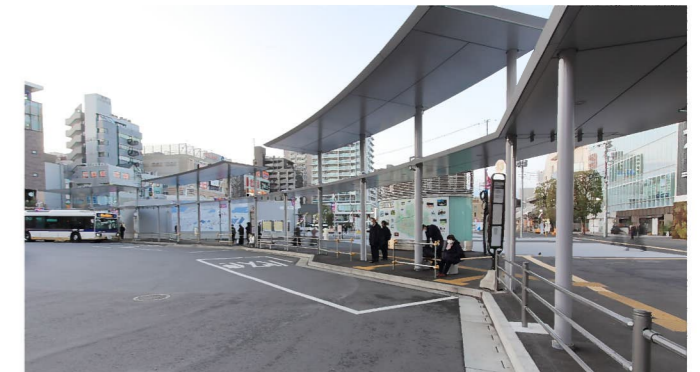
参考：北側ロータリー上屋