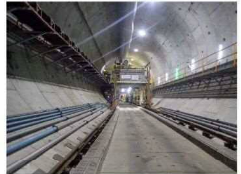
Hランプ坑内(シールド先端部)