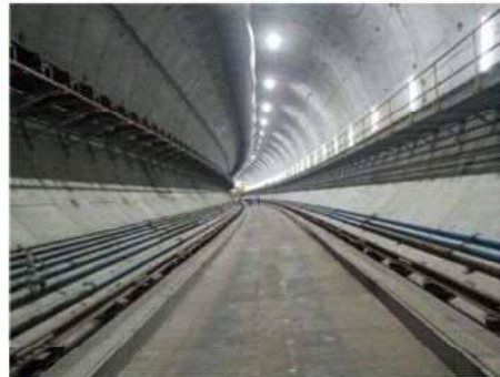
Hランプ坑内(シールド構築状況)