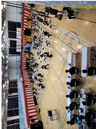
4/3(土)世田谷区での説明状況 (世田谷区立砧小学校)