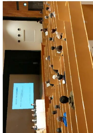
4/4(日)杉並区での説明状況 (杉並区勤労福祉会館)