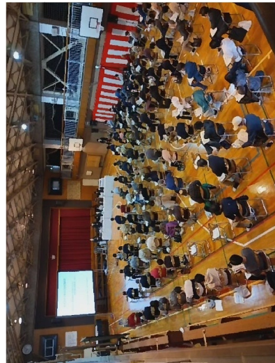
4/4(日)武蔵野市での説明状況 (武蔵野市立本宿小学校)