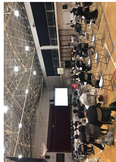
4/7(水)三鷹市での説明状況 (三鷹市立北野小学校)