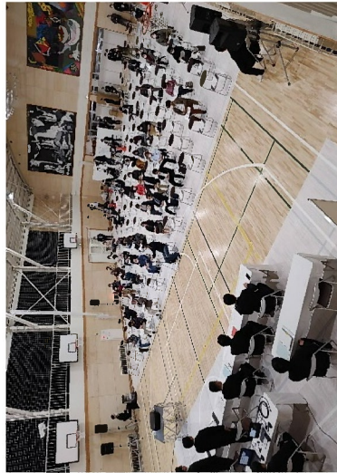
4/2(金)陥没・空洞箇所周辺での説明状況 (調布市立第四中学校)