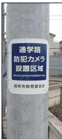
【啓発用巻き看板設置事例】