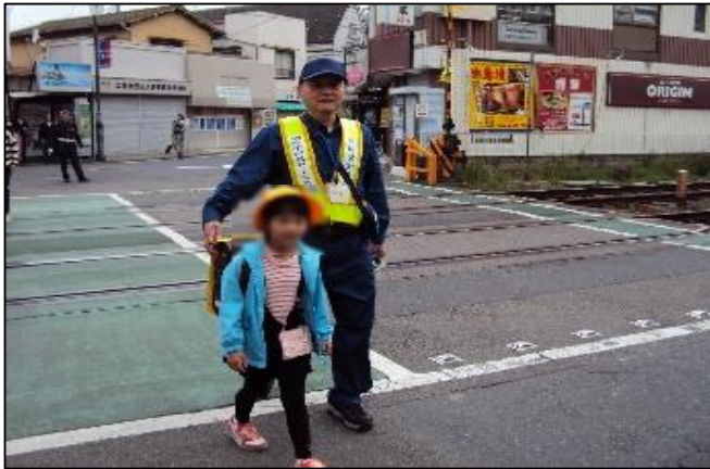
【柴崎駅東側踏切での見守り活動の様子】