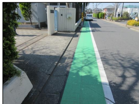
【ガードレールの代替としてカラー舗装化した事例】