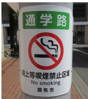
【路上等喫煙禁止区域】