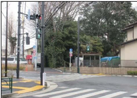
【信号機を歩車分離式に改善した事例】