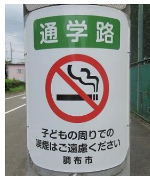
【その他の通学路上】