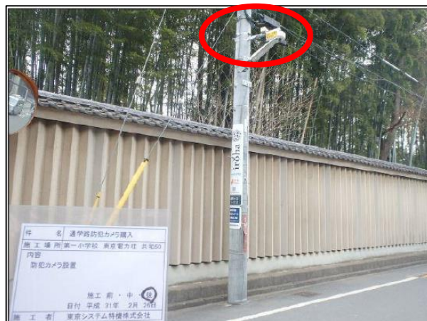
【防犯カメラ設置事例】