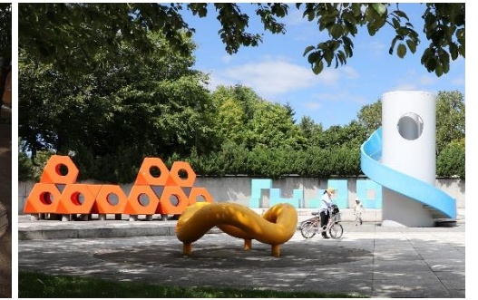
図7 モニュメント・ストリートファニチャー