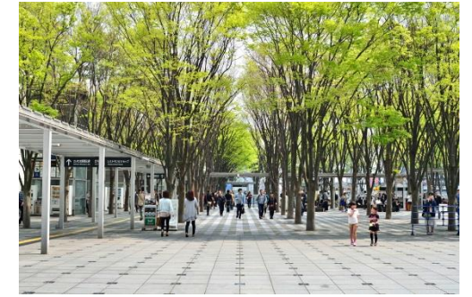
図6 樹木を配置した駅前広場