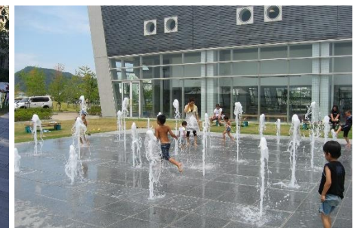
図9 噴水（ドライ噴水方式）