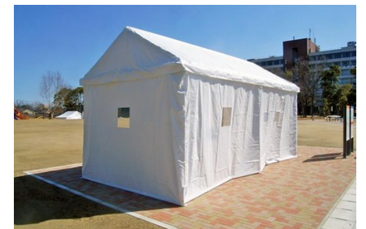
図11 広場を避難場所として活用