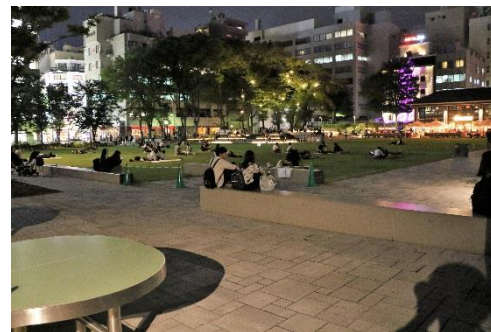
図5 イベント広場（夜間の利用）