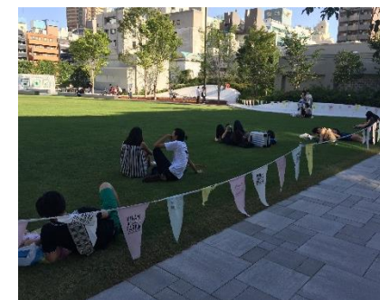
図8 芝生のある広場