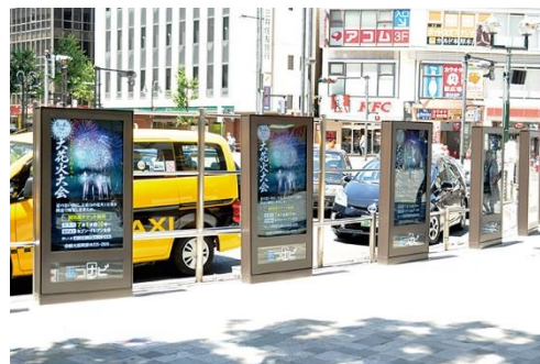
図10 デジタルサイネージ