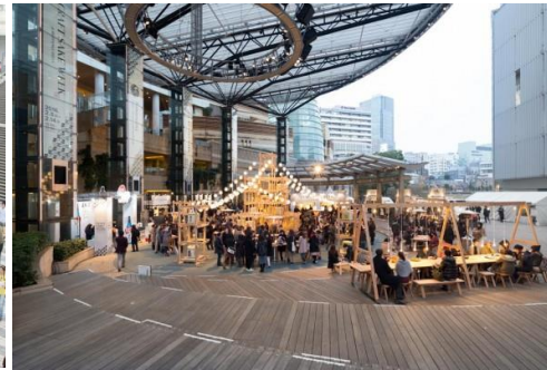
図4 大屋根空間でのイベント