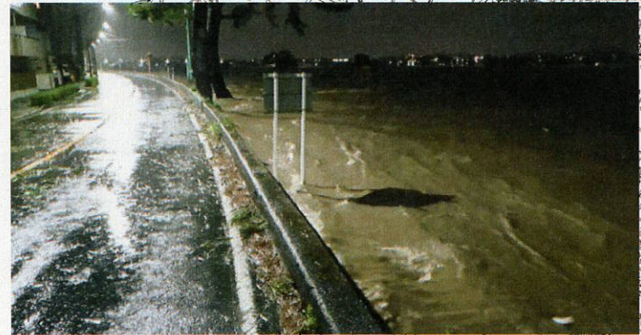
多摩川堤通りの通行抑制のため通行止め