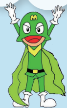
みどりがおかじどうかん 緑ヶ丘児童館 みどりん仮面