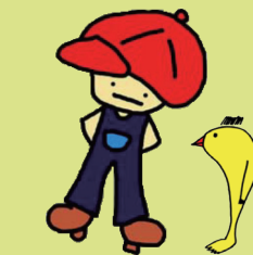
青少年ステーション CAPS グッティー(左)とようすけ(右)