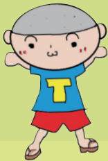
とうぶじどうかん 東部児童館 とーぶくんと とーびいもうと