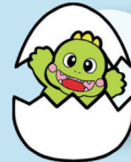
たまがわじどうかん 多摩川児童館 たまごん