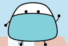
ふじみじどうかん 富士見児童館 ふじみちゃん