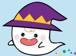
ちょうふがおかじどうかん 調布ヶ丘児童館 ドロン