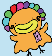
さずじどうかん 佐須児童館 さずら