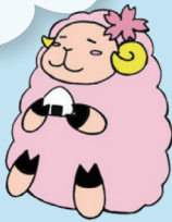
そめちじどうかん 染地児童館 そんめえ〜