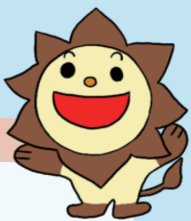
こくりょうじどうかん 国領児童館 ひまライ