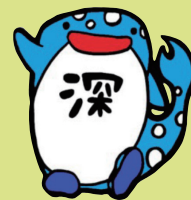
じんだいじじどうかん 深大寺児童館 じんじん