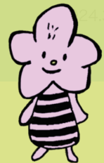
つつじがおかじどうかん つつじヶ丘児童館 つつじまくん