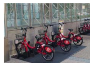
レンタサイクルポート(例)