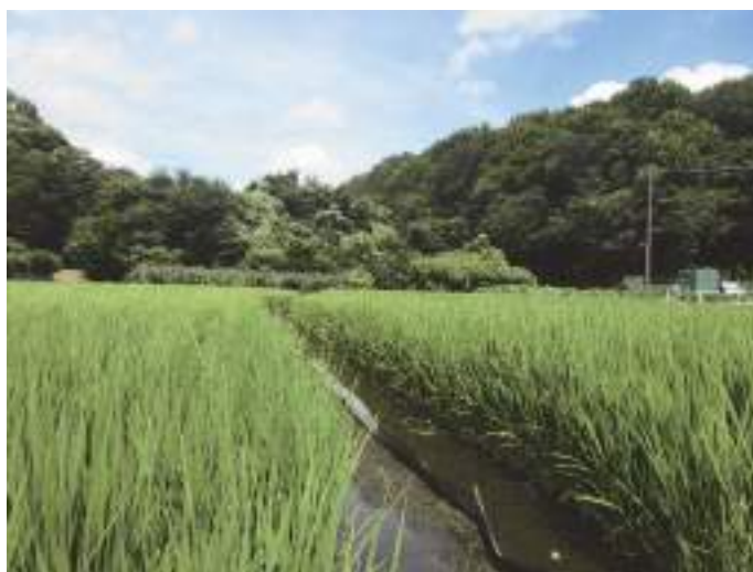
田園風景（佐須地域）

都市農地の保全に関する各種制度を用い、里山環境を構成する貴重な都市農地の保全を図ります。