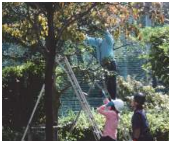
市民せん定講座の様子