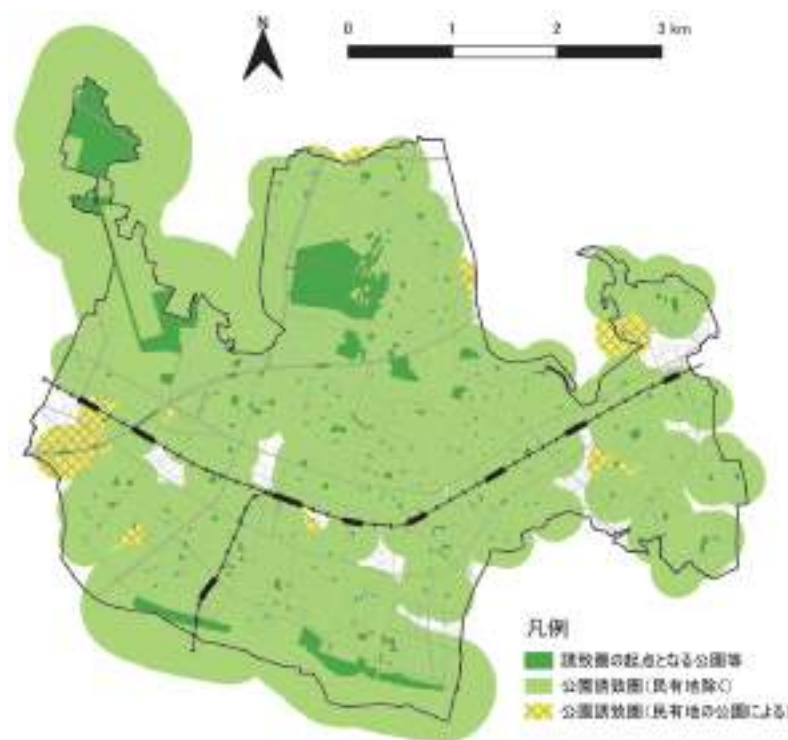
図表 公園等の分布と誘致圏 【再掲】

※対象は原則として公園・児童遊園・仲よし広場とし、緑地のうち多摩川自然観察緑地については、規模や河川敷として一体的な利用が考えられることから対象とした。