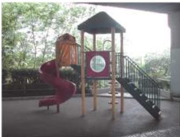
高速第一児童遊園