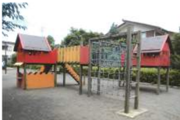
すわくぼ児童遊園