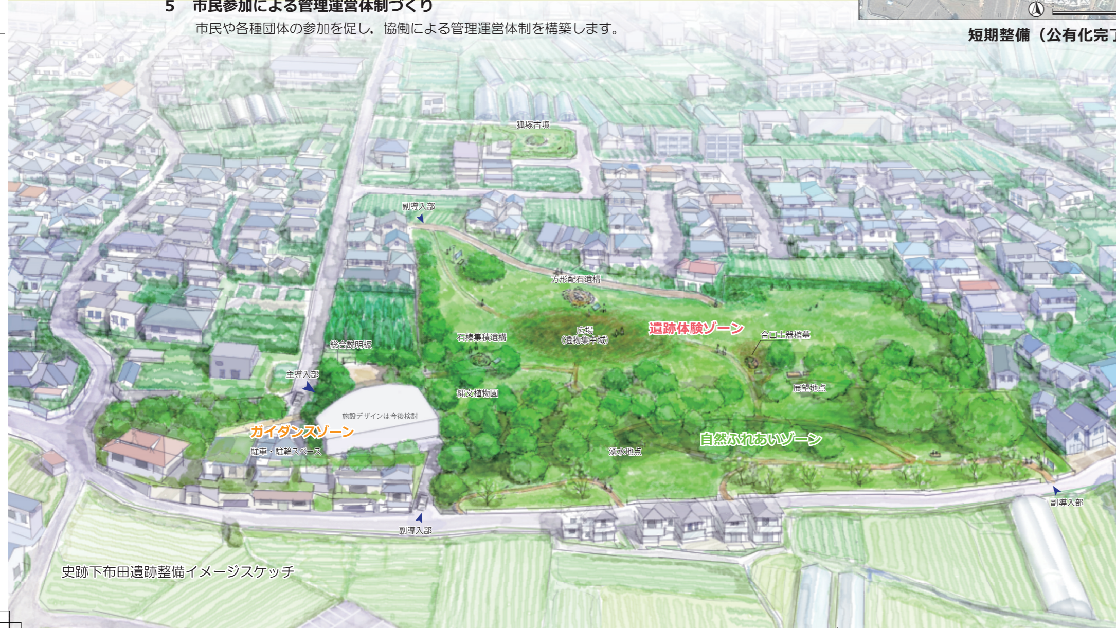
史跡下布田遺跡整備イメージスケッチ