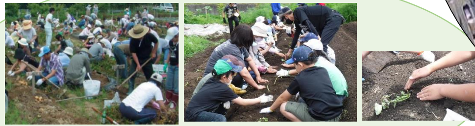
親子で農作業 児童のサツマイモ苗の植付け農体験(令和3年度)