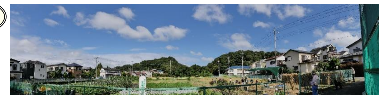
武蔵野の原風景と田園風景

<市民が身近に農と自然に触れ合える機会を創出> 環境市民団体などが造るビオトープの保全・育成 水田を視野に入れた取組につなげる。