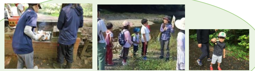
焼き芋体験 自然観察会 植物採取 緑地等で自然体験を通じて身近な環境を学ぶ(こどもエコクラブ)