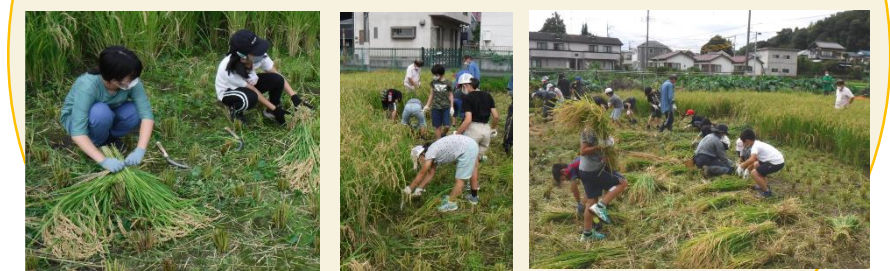
市内小学生や保護者等による田植えや稲刈などの体験 (令和3年度)