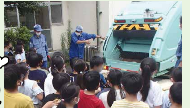
児童向け出前講座の様子

指導にあたった場所がきれいになっていると、とても成果を感じます。また、出前講座を通じて子ども達に収集車を間近で見てもらった際など、とても嬉しく思います。ごみ対策課では出前講座をいつでも受け付けています。是非、この機会にご活用ください!