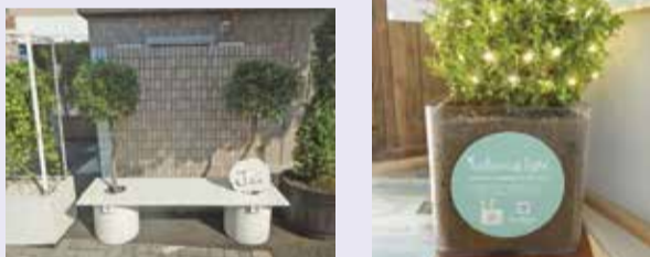
再生プラスチックを用いた「ベンチプランター」と「ボタニカルライト」(調布駅前広場に設置)

地球温暖化をはじめとする環境問題について、環境・緑の保全やリサイクルの推進など、調布市と連携して取り組んでいます。