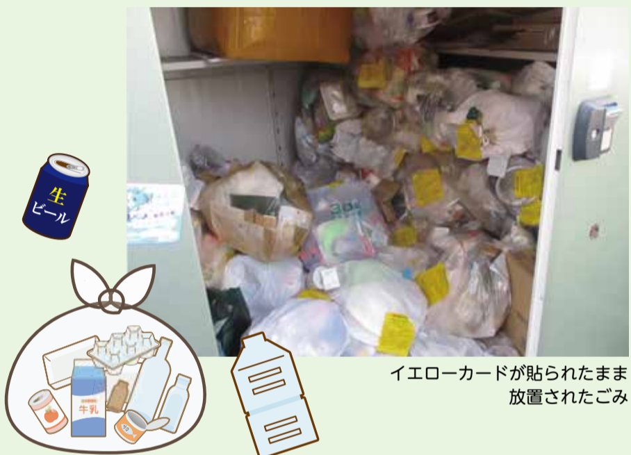
イエローカードが貼られたまま放置されたごみ

主に集合住宅から出るごみ袋で、イエローカード(分別が不適切でごみが収集されない場合などに用いるシール)が貼られて、長い間放置されるケースがしばしばあります。そのような状態は不衛生で周辺地域の迷惑にもなってしまうため、物件の所有者や管理者に連絡し、正しい分別・排出をお願いしています。