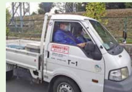
資源物持ち去りパトロールの様子