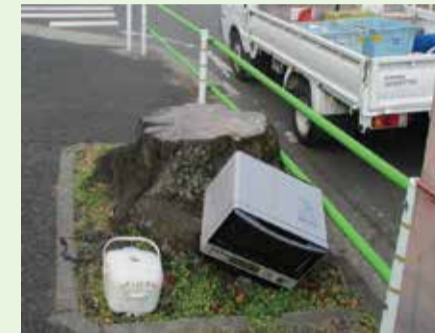
路上に不法投棄された家電

不法投棄(ルールを守らず道路や私有地に勝手にごみを捨てること)や、悪質業者による資源物(カン、新聞など)の無断持ち去りが後を絶たないため、それらの防止を目的としたパトロールを実施しています。これらの通報をお寄せいただくと、現場確認を実施し、再発防止に向け、その地域を重点的にパトロールします。