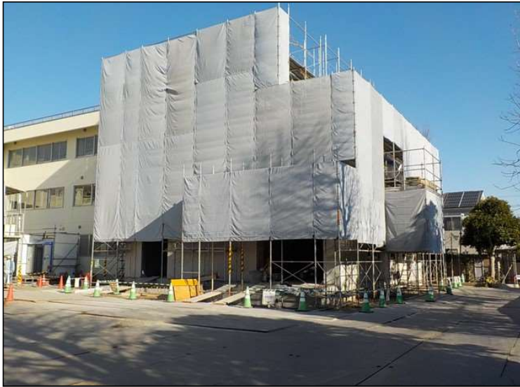
No.4 調布市立多摩川小学校校舎増築工事 躯体工事 施工状況