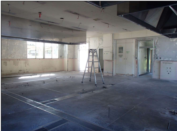
No.2 調布市立国領小学校給食室ほか改修工事 調理室内部撤去 施工状況