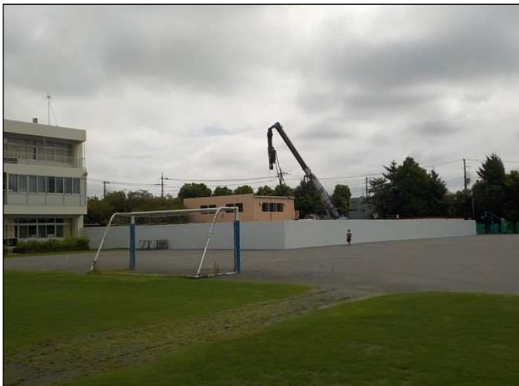
No.5 調布市立布田小学校校舎増築工事 仮囲い 設置状況