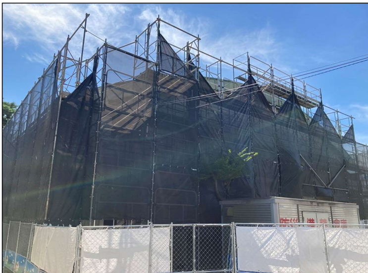
No.3 調布市立上ノ原小学校体育館外部改修工事 仮設足場 設置状況