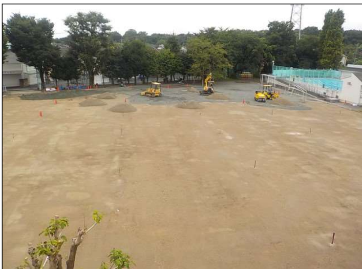
No.6 調布市立北ノ台小学校校庭整備工事 校庭 施工状況