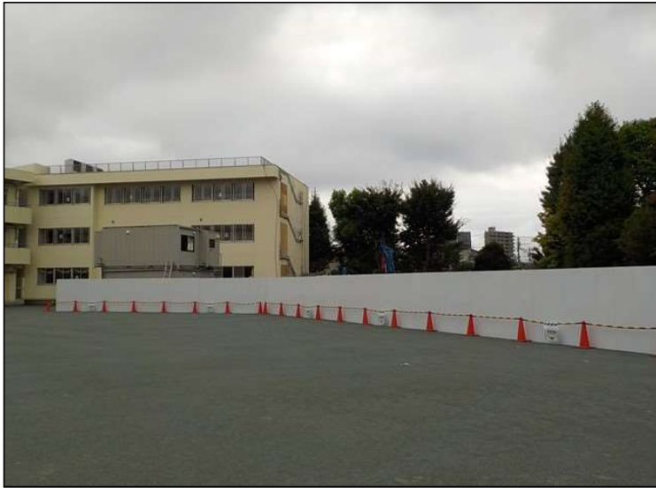
No.4 調布市立多摩川小学校校舎増築工事 仮囲い 設置状況