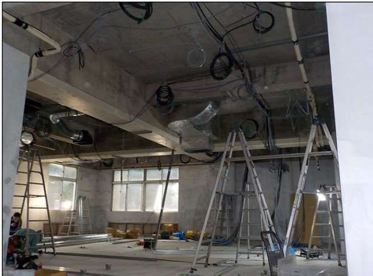
No.2 調布市立国領小学校給食室ほか改修工事 調理室内 施工状況