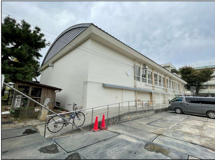
No.1 調布市立第一小学校体育館改修工事 体育館外部 施工状況