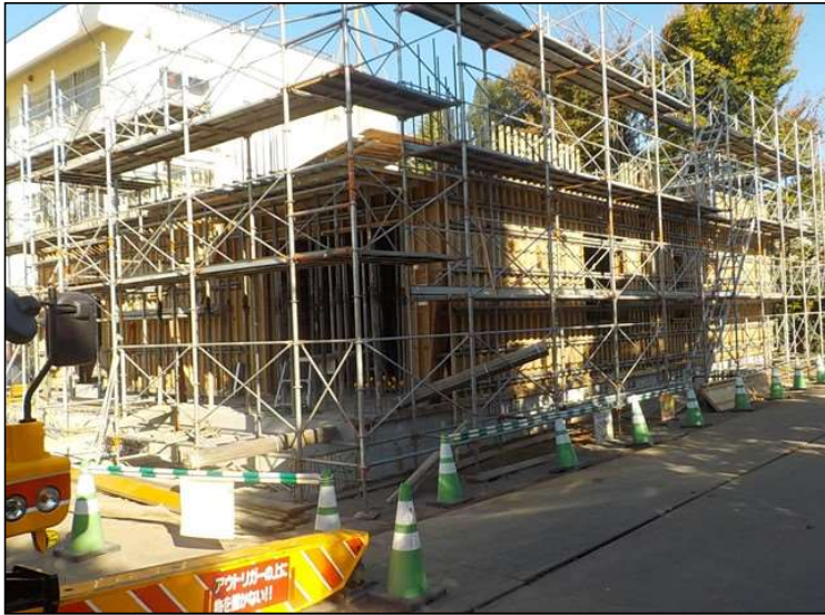
No.4 調布市立多摩川小学校校舎増築工事 1階躯体工事 施工状況