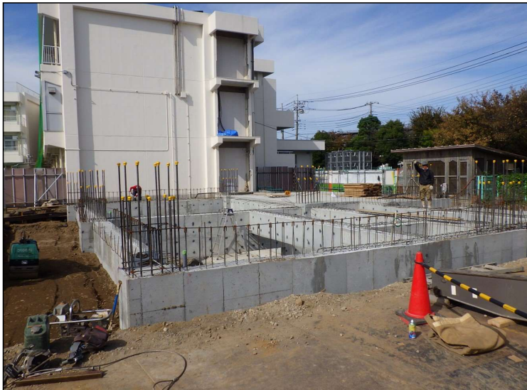
No.5 調布市立布田小学校校舎増築工事 基礎工事 施工状況