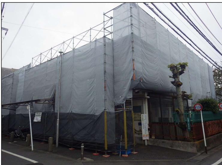
No.6 調布市立東部保育園・調布市立東部児童館・ 調布市東部公民館外壁及び屋上防水改修工事 外部仮設足場 設置状況