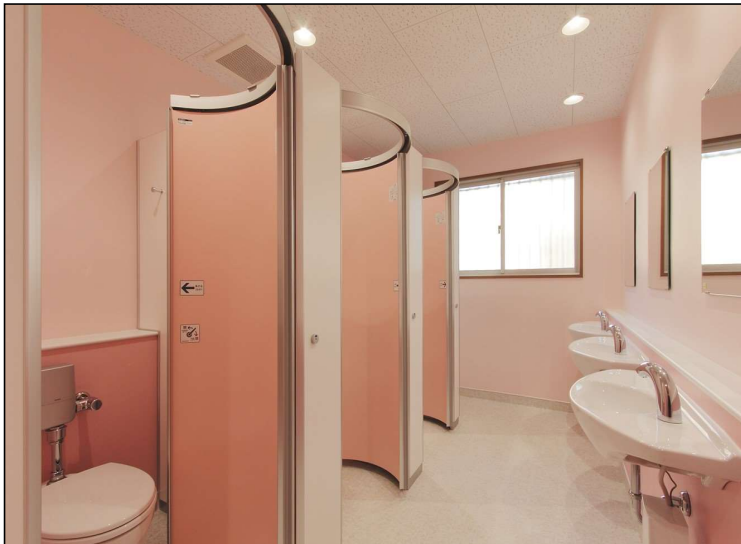
No.2 調布市立布田小学校体育館内部改修工事 女子トイレ 施工完了