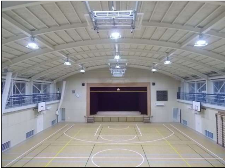
No.1 調布市立北ノ台小学校体育館改修工事 体育館内部 施工完了