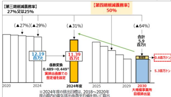
R5.3.3 第5回「削減義務実施に向けた専門的事項等検討会」